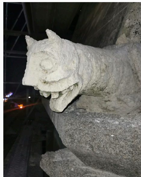
↓ L'une des chimères décoratives. Clocher de l'église Saint Jacques.