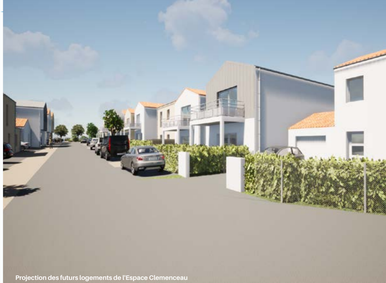
Projection des futurs logements de l'Espace Clemenceau